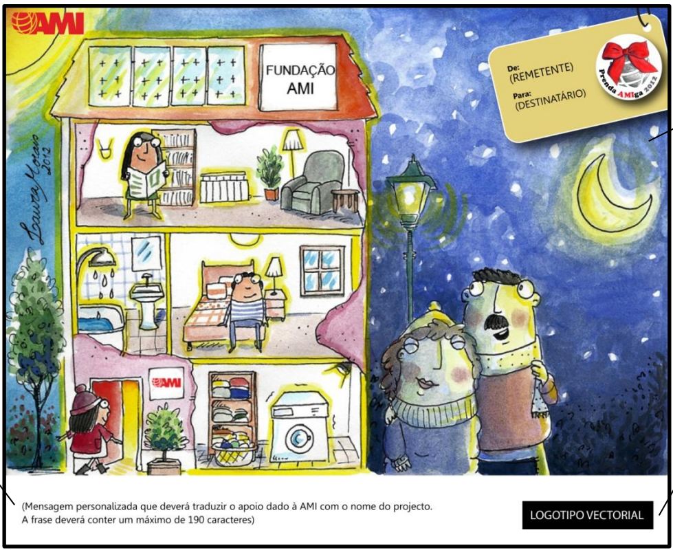
ILUSTRAÇÃO + MENSAGEM + LOGOTIPO

Frase até 190 caracteres. Deverá mencionar o nome do projecto apoiado.